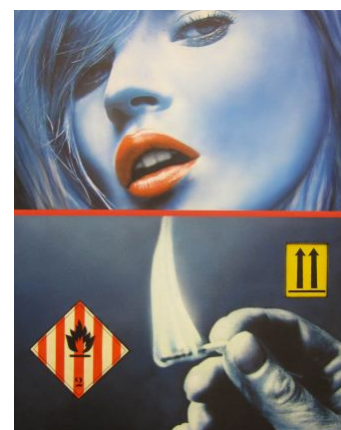
Bleu face / 2 flèches inflammable 2 Acrylique sur toile et jet d'encre 92 x 73 cm 2007