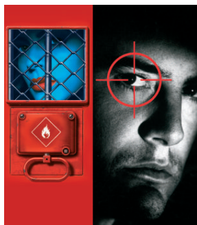
Under Control Acrylique sur toile et jet d'encre 162 x 150 cm 2009